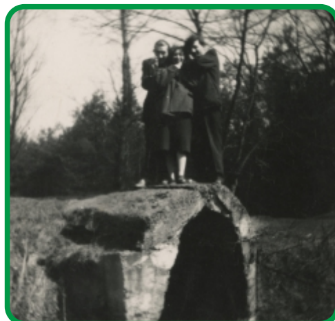
Wylot sztolni . Przełom lat sześćdziesiątych i siedemdziesiątych XX wieku.

W lutym 2016 roku oficjalnie została otwarta Zachodnia Obwodnica Chrzanowa. To nowa trzykilometrowa droga, która połączyła dwa chrzanowskie osiedla - Kąty i Krocymiech, a zarazem drogę wojewódzką z Chrzanowa do Oświęcimia i drogę krajową nr 79 z Chrzanowa do Jaworzna. Kierowcy mogą dojechać do autostrady A4 omijając Chrzanów. Nowa droga kosztowała przeszło 20 mln zł, z czego większość stanowiła dotacja z Unii Europejskiej. Przed rozpoczęciem prac trwały negocjacje z Dyrekcją Lasów Państwowych, gdyż inwestycja wymuszała wycięcie prawie 120 hektarów lasów. Niestety, nikt nie zwrócił wtedy uwagi, że budowa będzie przebiegać nad sztolnią. Nikt z wykonawców i projektantów nie wiedział o jej istnieniu. Wspólnie z jednym z mieszkańców osiedla, zwróciliśmy się do wykonawcy informując o istnieniu zabytkowej sztolni i wskazaniu jej przebiegu. Na jakiś czas roboty w tym miejscu zostały wstrzymane. Zwróciliśmy uwagę, że w tunelu mogą