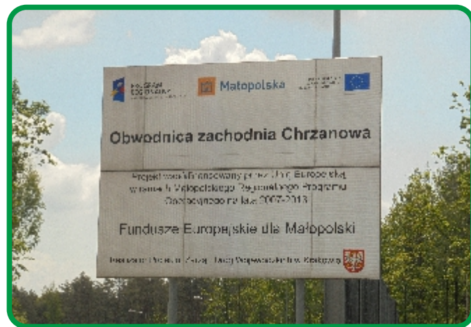
Budowa zachodniej obwodnicy Chrzanowa..