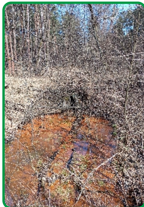
Wylot sztolni .Obecnie.