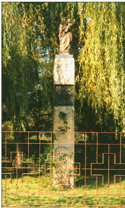
Figura Matki Bożej w ogrodzie plebańskim – róg ul. Dobczyckiej i Ogrodowej

W odległości 3 m od chodnika, za ażurowym, metalowym ogrodzeniem, na kwadratowym (50x50cm) obelisku z dolomitu, wysokim na 3,5 m – w czerwcu 1981r. postawiona została zabytkowa figura Matki Bożej w koronie, trzymającej Dzieciątko Jezus, które podniesioną rączką błogosławi. Wysokość figury 80 cm.