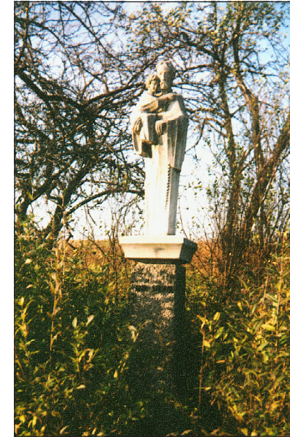
Figura św. Józefa przy ul. Trzebińskiej - poniżej autostrady

Droga z Chrzanowa do Trzebini przechodzi przez małe wzniesienie zwane Górą św. Józefa, na szczycie której od połowy XIX wieku stała na kamiennym cokole figura św. Józefa z Dzieciątkiem Jezus na ręce, ufundowana przez bliżej nieznaną rodzinę chrzanowską.