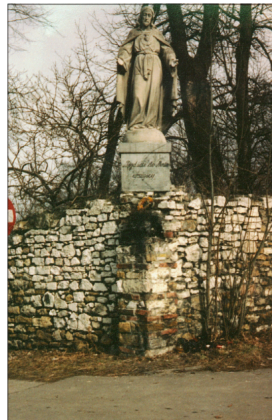
Figura Chrystusa Miłosiernego przy Kościele w Kościelcu (róg ulic Głównej i Dworskiej)

Na narożniku muru kamiennego otaczającego były park pałacowy ustawiona jest figura Chrystusa Miłosiernego – Najświętszego Serca Pana Jezusa wykuta w kamieniu – piaskowcu o wysokości 1,8 m. Figura stoi na kwadratowym cokole, również z kamienia, na przedniej ścianie cokołu widnieje napis: „ Pójdźcie do Mnie wszyscy ”.