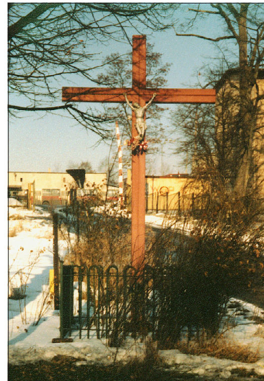
Krzyż przy ul. Śląskiej na Kątach - naprzeciw bramy wjazdowej do dawnej Kopalni „Matylda” obecnie (Energokam” - 64a)

W małym metalowym, ozdobnym ogrodzeniu stoi krzyż o wys. 4 m, z odlewem Chrystusa Ukrzyżowanego.