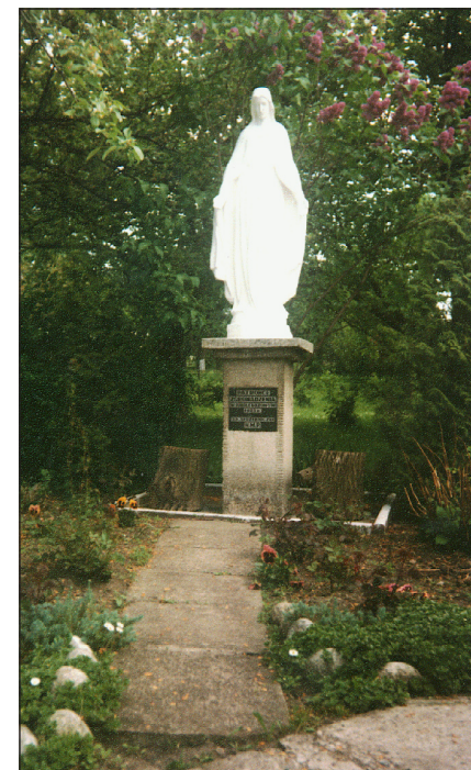
Figura wykonana z betonu o wys. 180 cm, pomalowana na biało, ustawiona jest na ozdobnym postumencie betonowym o wys. 120 cm.

Na przedniej ścianie postumentu umocowana jest kamienna tablica z napisem: Patronce Zgromadzenia w Jubileuszowym 1983r. – SS. Służebniczki N.M.P.