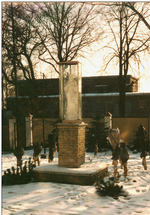
Figura M.B. Niepokalanie Poczętej przy ul. Śląskiej 62a - przed budynkiem Zakładu Opiekuńczo-Leczniczego

Na podstawie z kamienia wznosi się cokół, na którym, twarzą zwrócona do budynku, patronuje Zakładowi Opiekuńczo-Leczniczemu dobrotliwa postać Najświętszej Marii Panny. Biała figura o wysokości 1,20 m ustawiona jest w prosto-kątnej oszklonej gablocie.