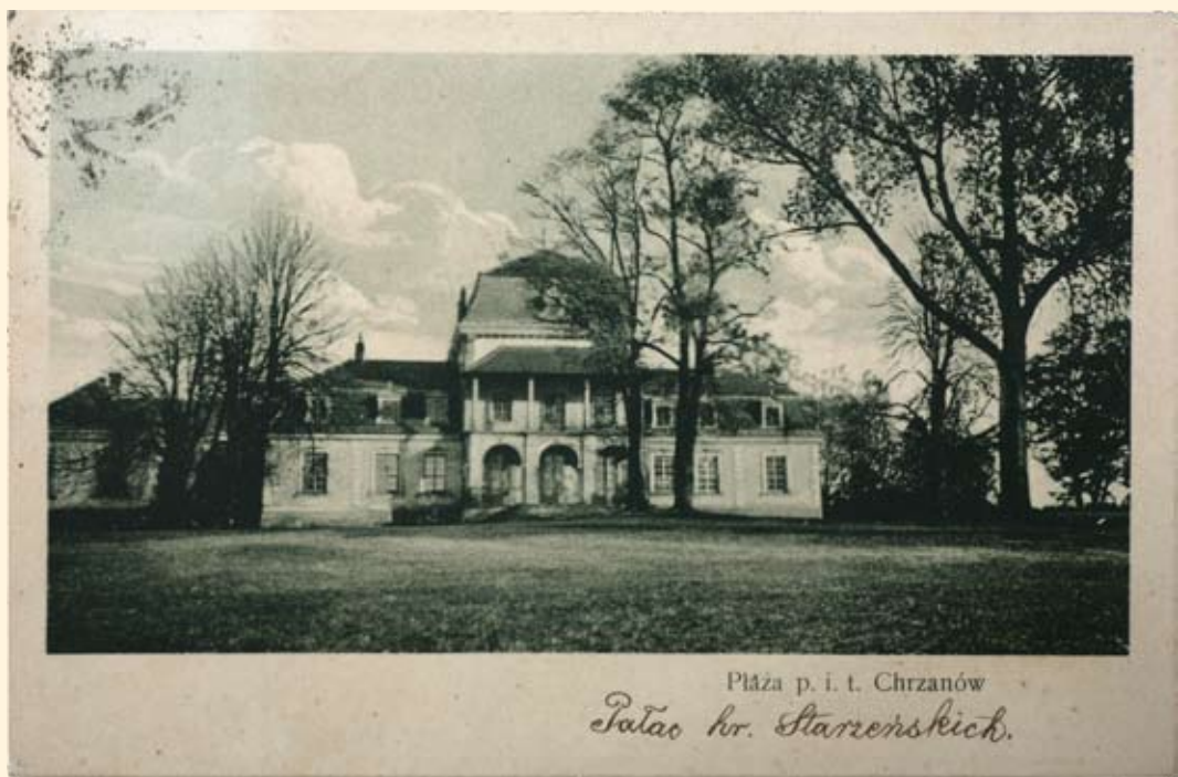
Ryc. 96 Pałac Starzeńskich w Płazie. 1911 r.