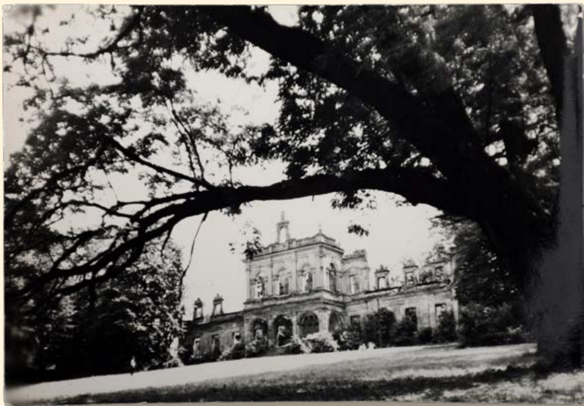
Ryc. 95 Pałac hr. Starzeńskich w Kościelecu. Wyd. „RUCH”, fot. H. Hermanowicz, 1968 r.