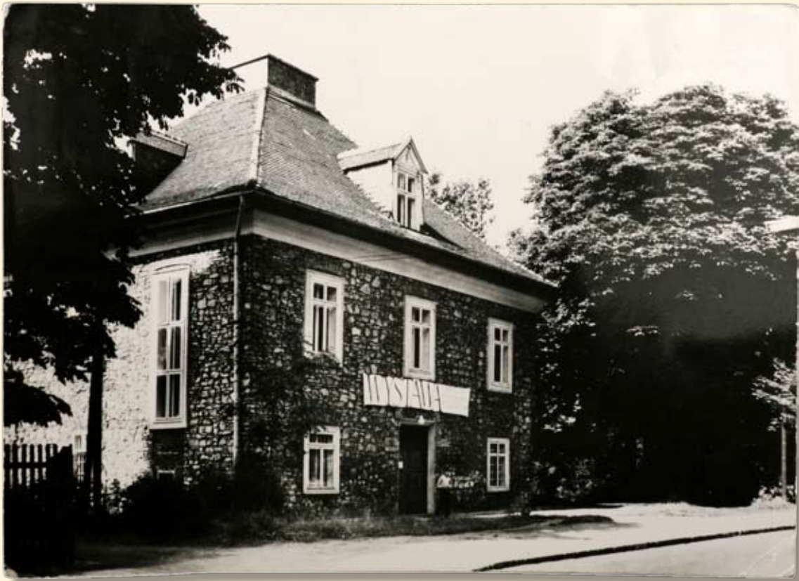
Ryc. 92 Muzeum Ziemi Chrzanowskiej (obecnie Muzeum w Chrzanowie). Wyd. „RUCH”, fot. K. Kaczyński.