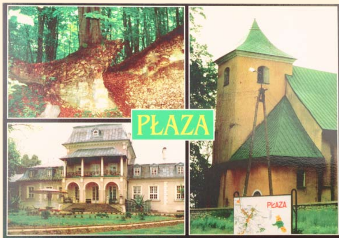
Ryc.99 Płaza - Grodzisko, Pałac Starzeńskich w Płazie, zabytkowy kościół z XVI w. Wyd. L.Z.S. „Tempo” Płaza, fot. M. Mordan, druk FHU „Bak-Print” Chrzanów.