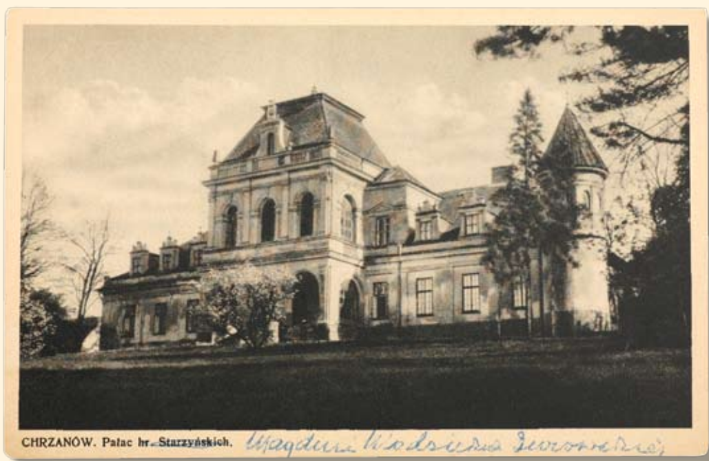
Ryc. 94 Pałac hr. Starzeńskich w Kościelecu (na pocztówce błąd w nazwisku właścicieli). Wyd. Księgarnia K. Palki w Chrzanowie, 1938 r.