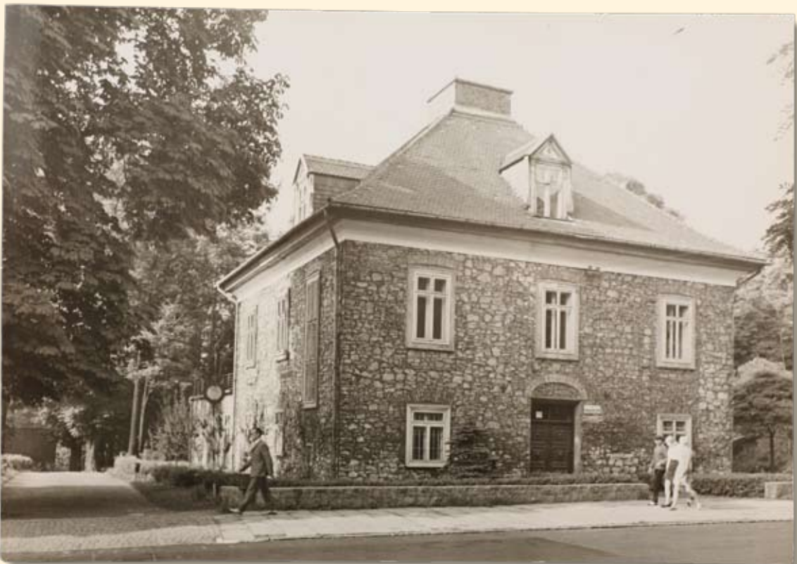
Ryc. 93 Muzeum Ziemi Chrzanowskiej (obecnie Muzeum w Chrzanowie). Wyd. Biuro Wydawniczo – Propagandowe, fot. J. Siudecki, 1973 r.