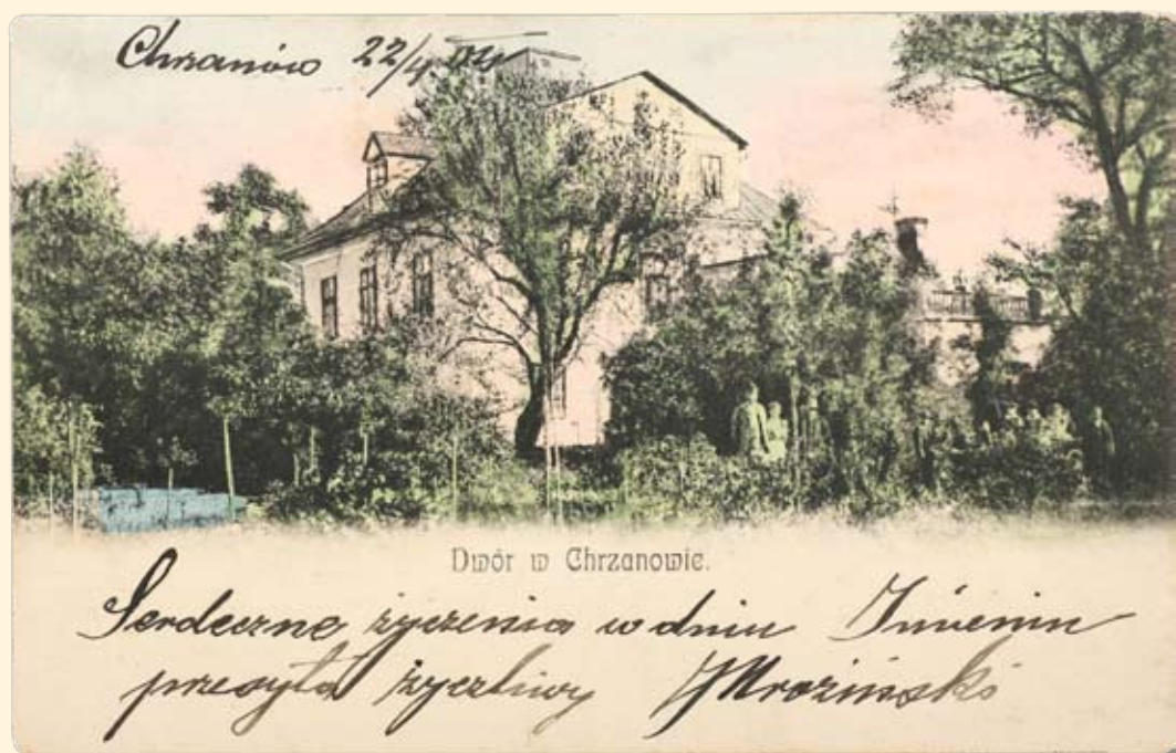
Ryc.88 Dwór – obecnie Muzeum w Chrzanowie. 1904 r.