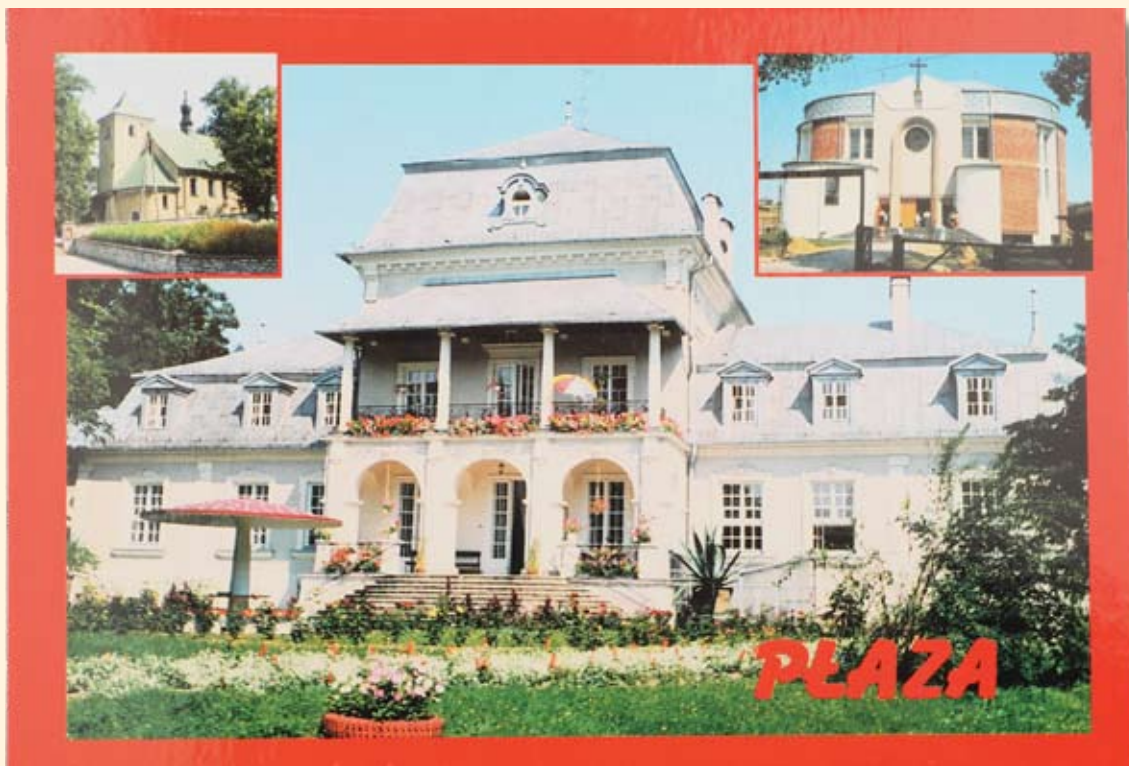
Ryc. 98 Pałac Starzeńskich w Płazie. Wyd. „ZEM”, fot. Z. Marszałek.