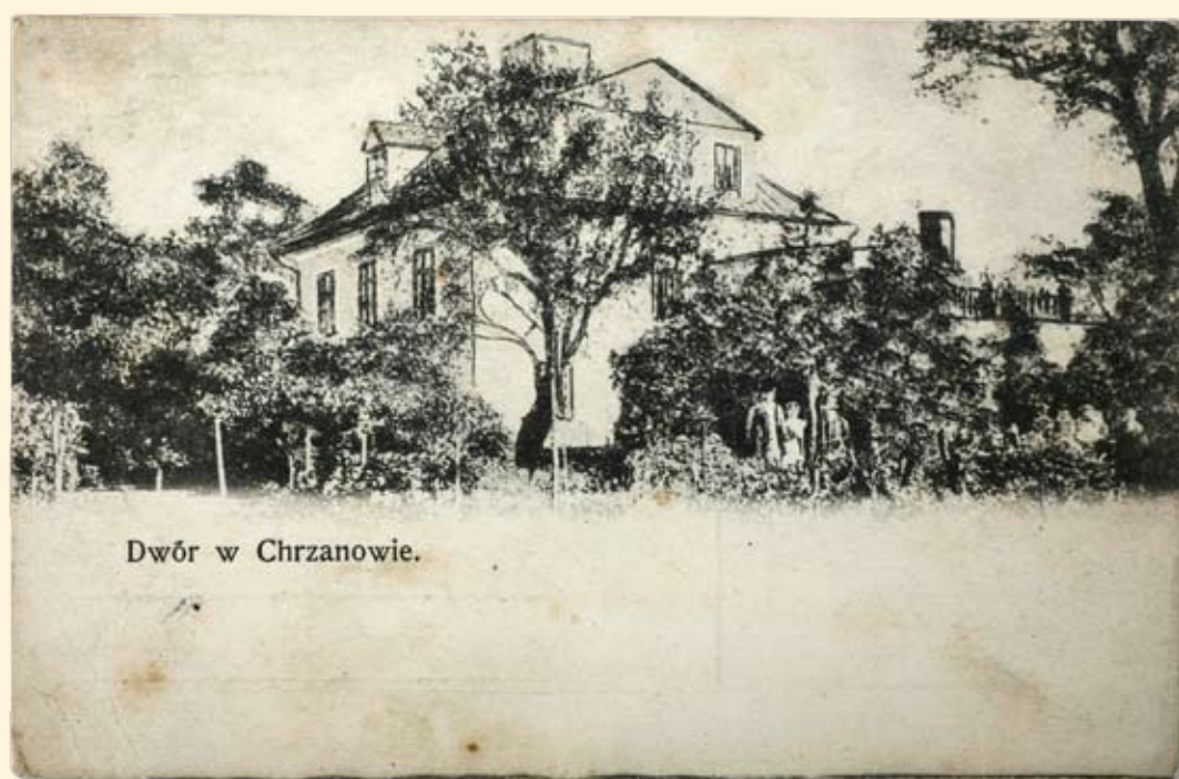
Ryc.89 Dwór – obecnie Muzeum w Chrzanowie. 1907 r.