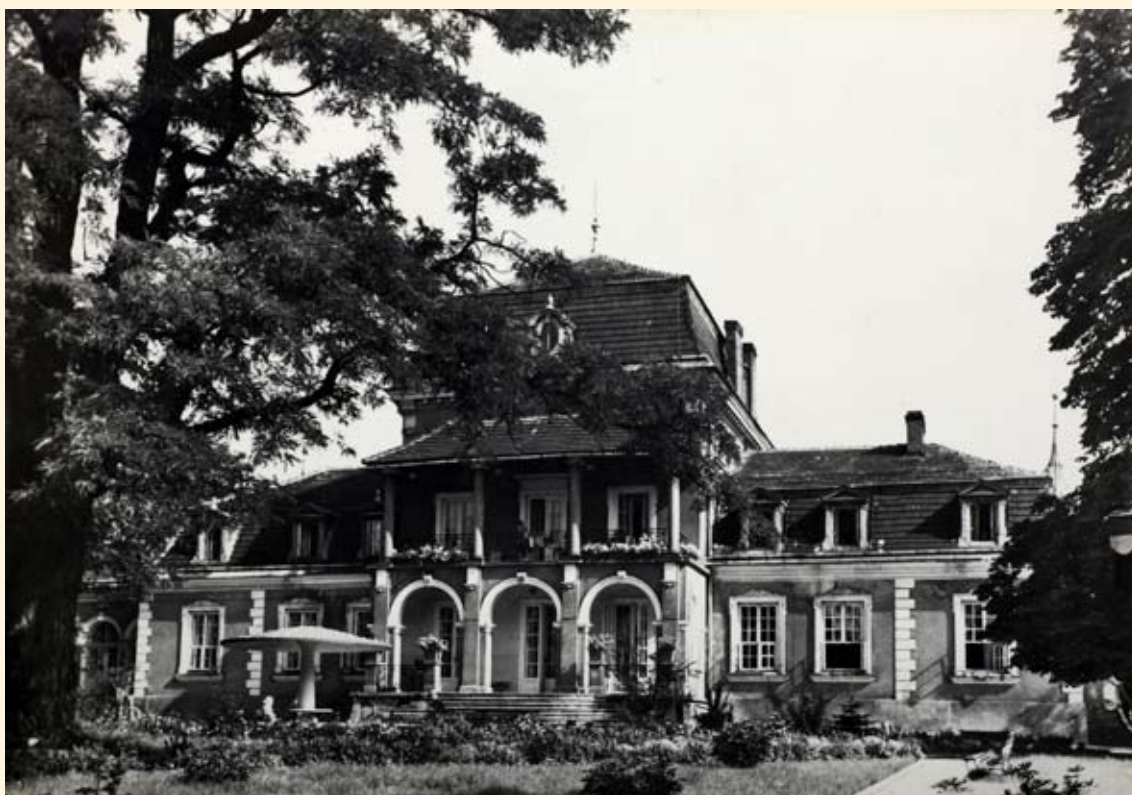
Ryc. 97 Pałac Starzeńskich w Płazie (Barokowy dwór z XVIII w. Przebudowany w latach 1900-1901).