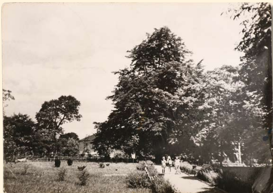
Ryc. 91 Park miejski. Wyd. „RUCH”, fot. H. Hermanowicz, 1966 r.