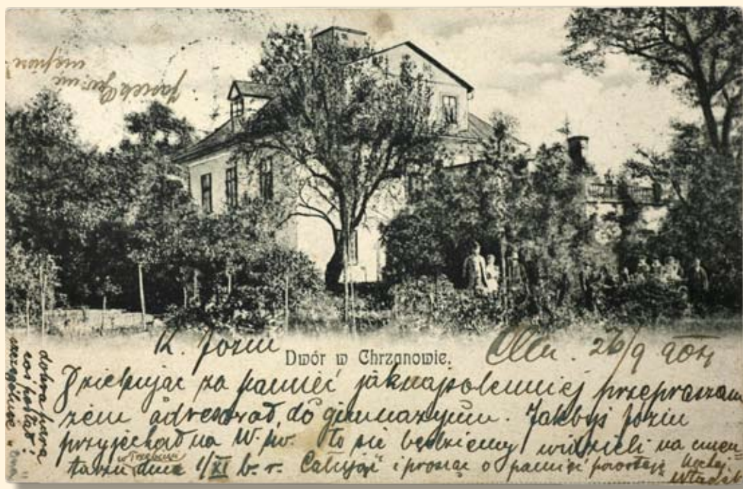
Ryc. 90 Dwór – obecnie Muzeum w Chrzanowie. 1904 r.