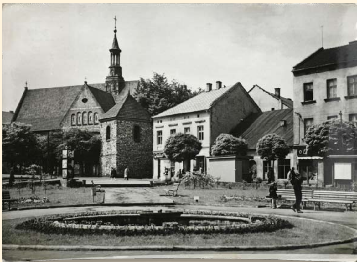
Ryc. 31 Rynek – kościół św. Mikołaja. Wyd. „RUCH”, fot. L. Święcki, 1961 r.