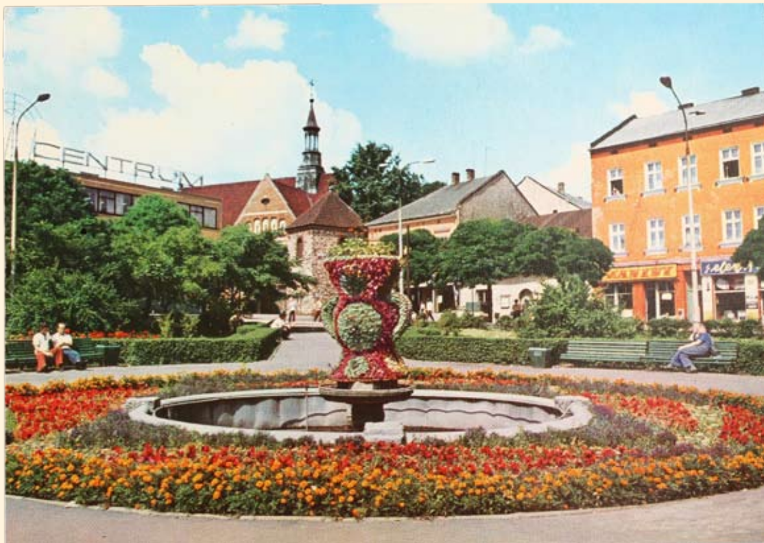
Ryc. 40 Rynek – kościół św. Mikołaja i dom handlowy „Centrum”. Wyd. Krajowa Agencja Wydawnicza, fot. J. Rosikoń, 1981 r.