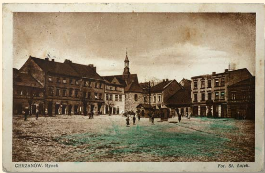
Ryc. 25 Rynek – pierzeja zachodnia i północna - widok na kościół św. Mikołaja. Wyd. Kazimierz Zarębski, fot. Stanisław Łojek, Chrzanów, 1930 r.