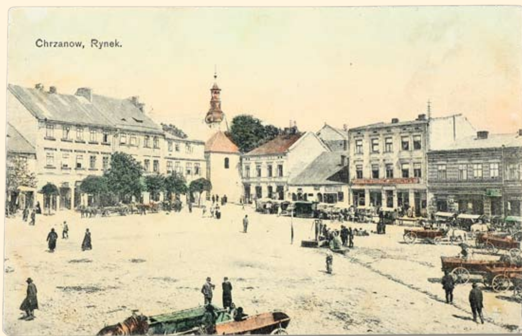
Ryc. 20 Rynek – pierzeja zachodnia i północna - widok na kościół św. Mikołaja. Nakł. T.K.Ch., 1914 r.