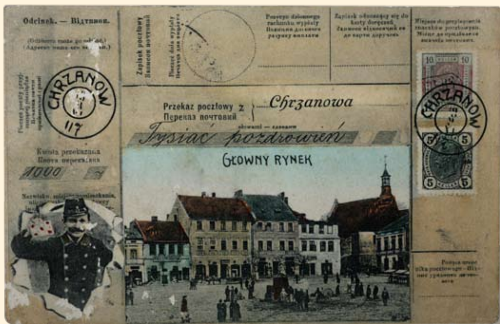
Ryc. 14 Rynek - pierzeja zachodnia i kościół św. Mikołaja. Wyd. J. Klein, Kraków, 1907 r.