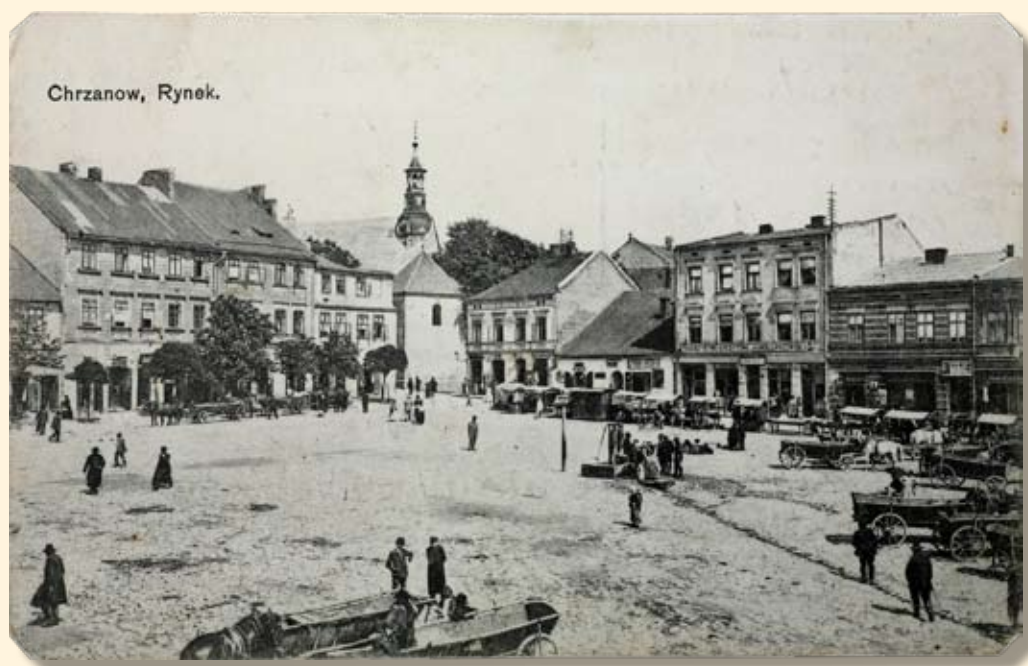
Ryc. 19 Rynek – pierzeja zachodnia i północna - widok na kościół św. Mikołaja. Nakł. T.K.Ch., 1914 r.