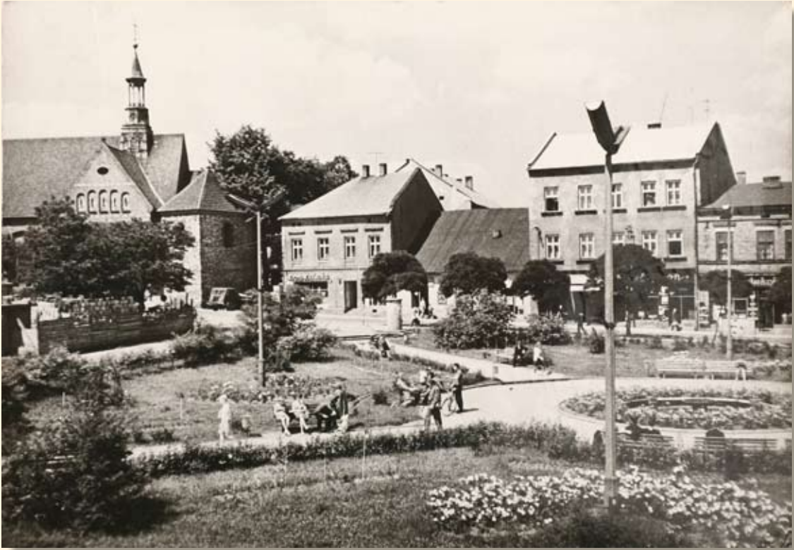
Ryc. 34 Rynek – kościół św. Mikołaja. Wyd. „RUCH”, fot. H. Hermanowicz, 1967 r.