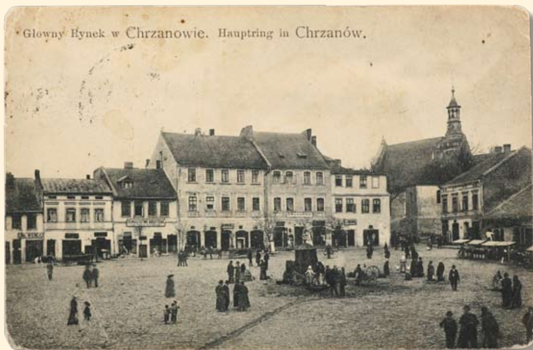
Główny Rynek w Chrzanowie. Hauptring in Chrzanów.