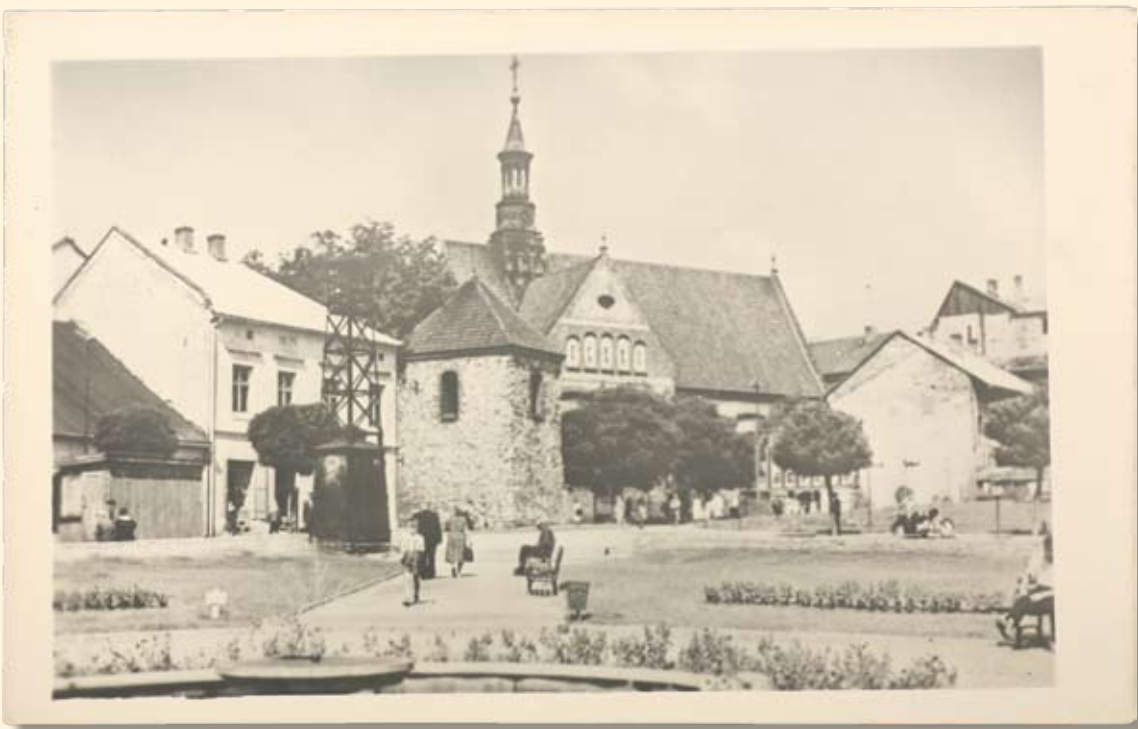
Ryc. 27 Rynek – kościół św. Mikołaja (błędny druk – odbicie lustrzane). Wyd. „RUCH”, fot. H. Hermanowicz, 1958 r.