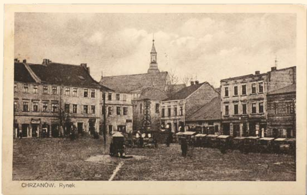
Ryc. 23 Rynek – pierzeja zachodnia i północna - widok na kościół św. Mikołaja. Nakł. M. Kornblum, Chrzanów, 1920 r.

„By night” series: Market Square by night. Publisher: T.K.Ch., 1914.