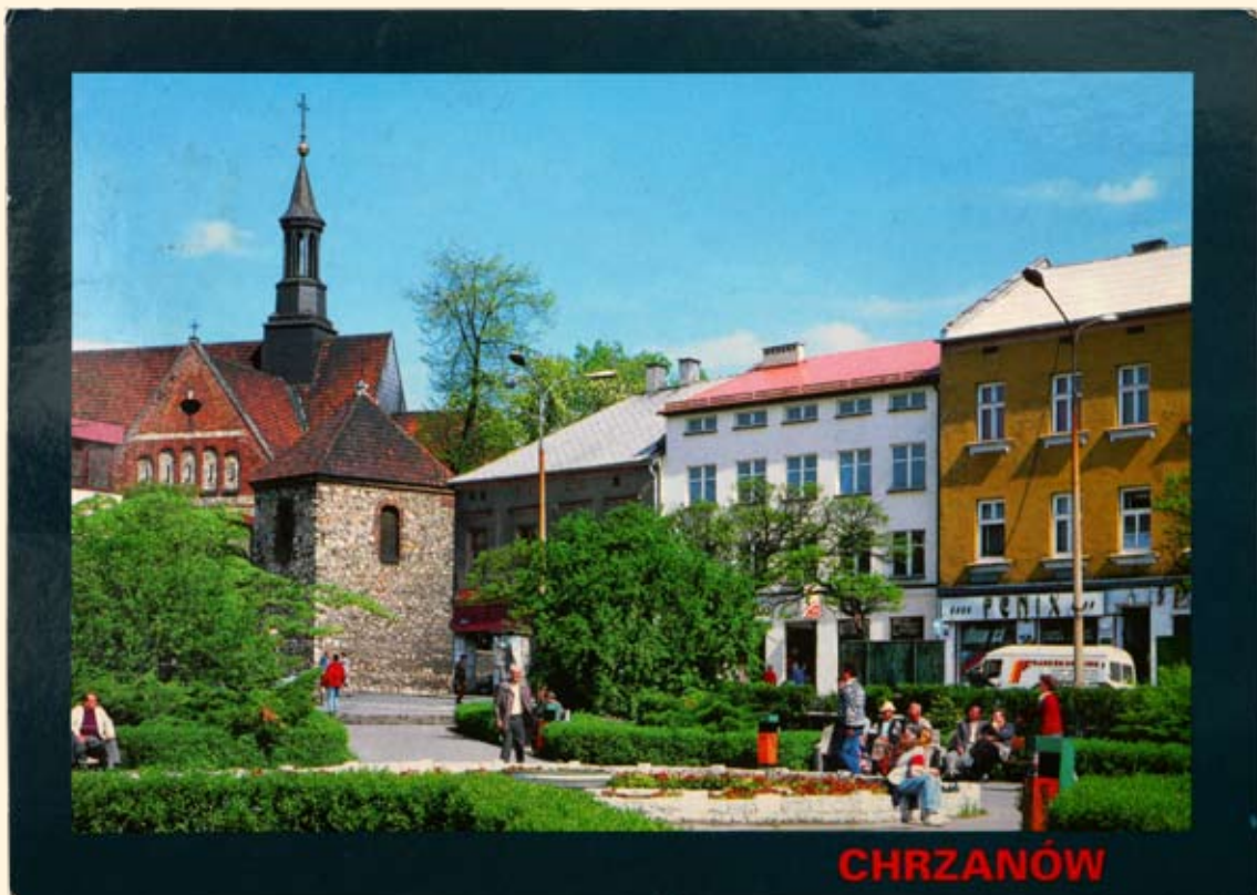
Ryc.44 Rynek – kościół św. Mikołaja. Wyd. a.w.a. Bielsko-Biała, fot. K. Pilecki.