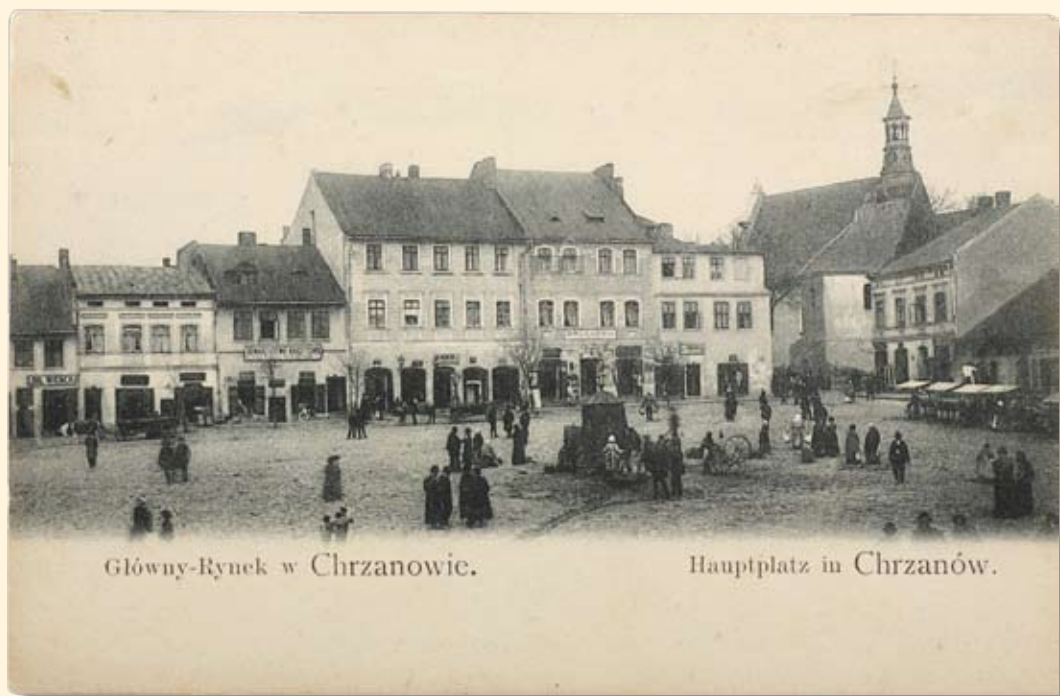
Główny-Rynek w Chrzanowie.