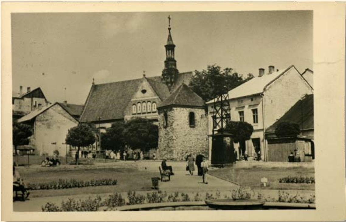
Ryc. 26 Rynek – kościół św. Mikołaja. Wyd. „RUCH”, 1958 r.