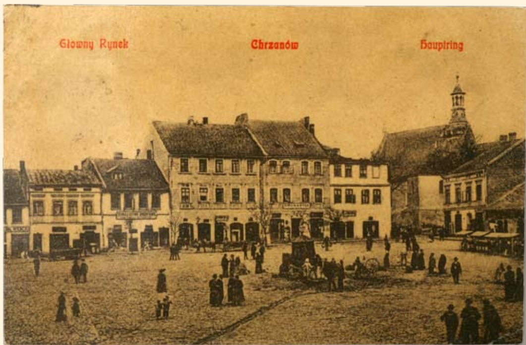
Ryc. 12 Rynek - pierzeja zachodnia i kościół św. Mikołaja. Nakł. A. Honigwachs, Chrzanów,

Market Square – the western frontage. Publisher: A. Honigwachs, Chrzanów.