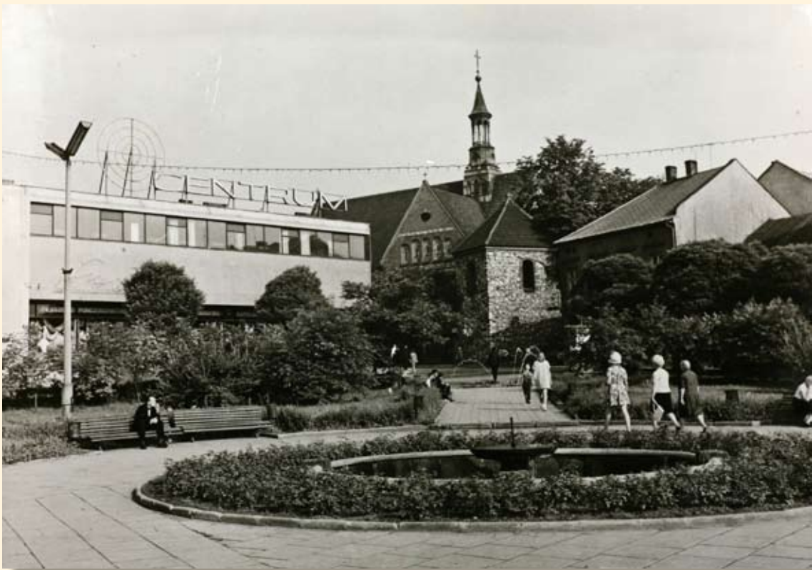
Ryc. 36 Rynek – kościół św. Mikołaja i dom handlowy „Centrum”. Wyd. Krajowa Agencja Wydawnicza, fot. J. Siudecki, 1972 r.