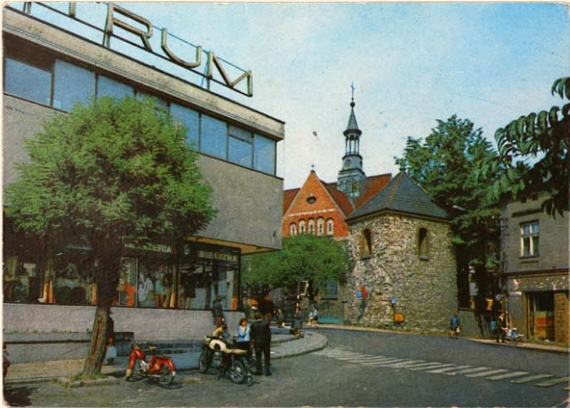
Ryc.37 Rynek – kościół św. Mikołaja i dom handlowy „Centrum”. Wyd. „RUCH”, fot. K. Jabłoński ,1972 r.