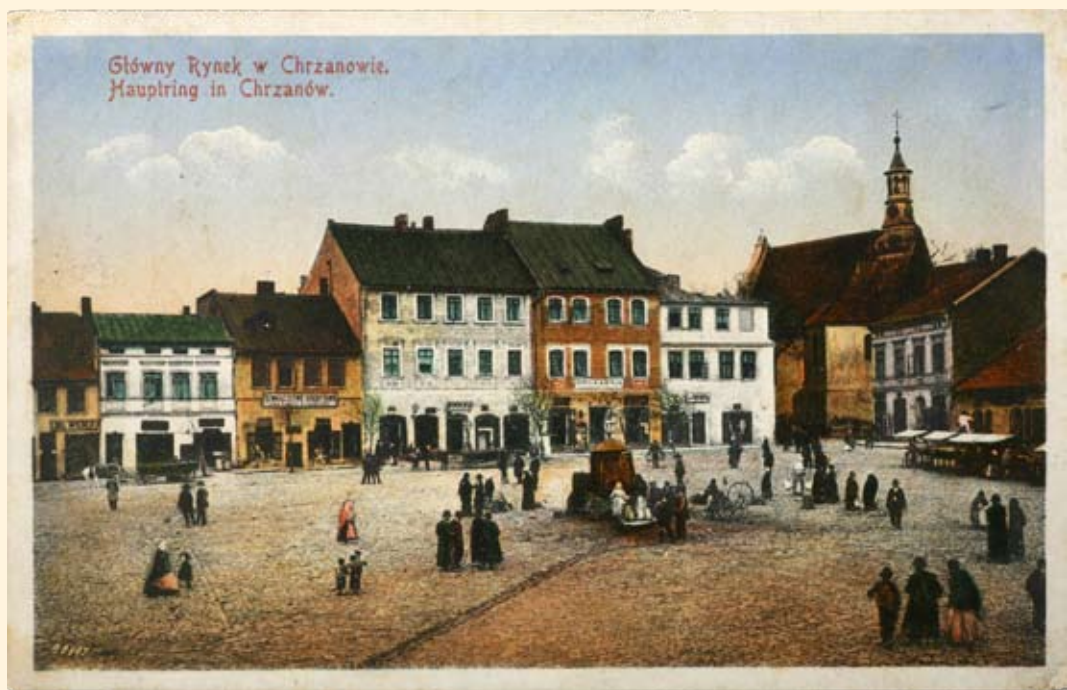
Ryc. 13 Rynek - pierzeja zachodnia i kościół św. Mikołaja. Nakł. J. Klein. Kraków, 1910 r.

Market Square – the western frontage. Publisher: A. Honigwachs, Chrzanów.