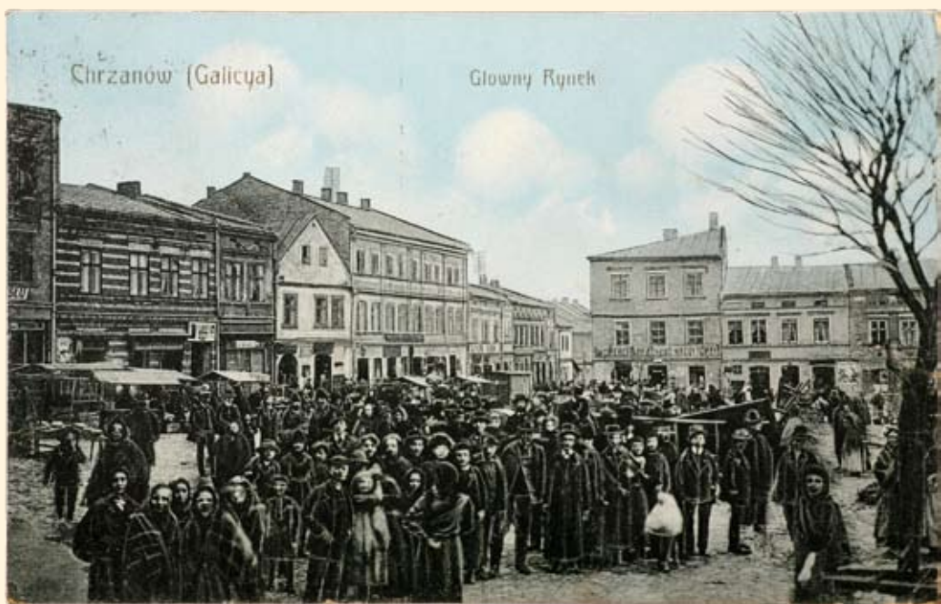
Ryc. 16 Rynek - pierzeja północna i wschodnia, perspektywa ul. Krakowskiej. Zdjęcie zrobione w dzień targowy. 1911 r.