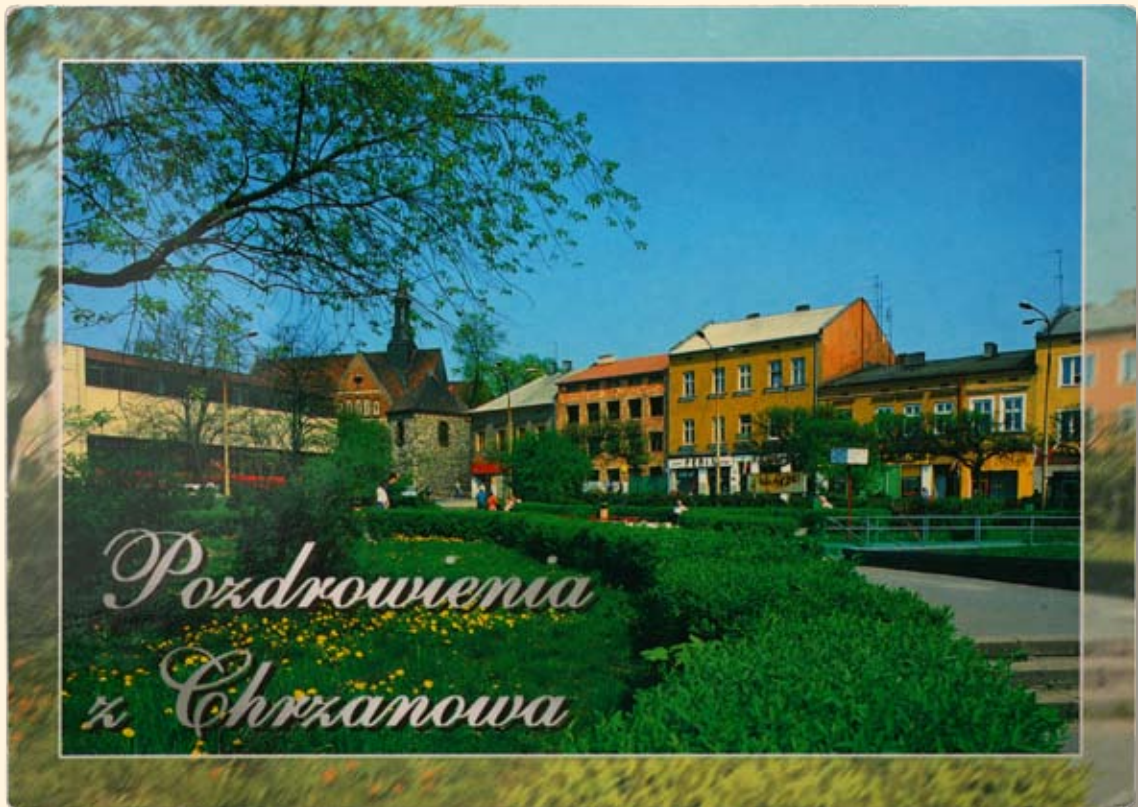
Ryc.43 Rynek – kościół św. Mikołaja. Wyd. CRUX, fot. K. Mroziwski, 1998 r.