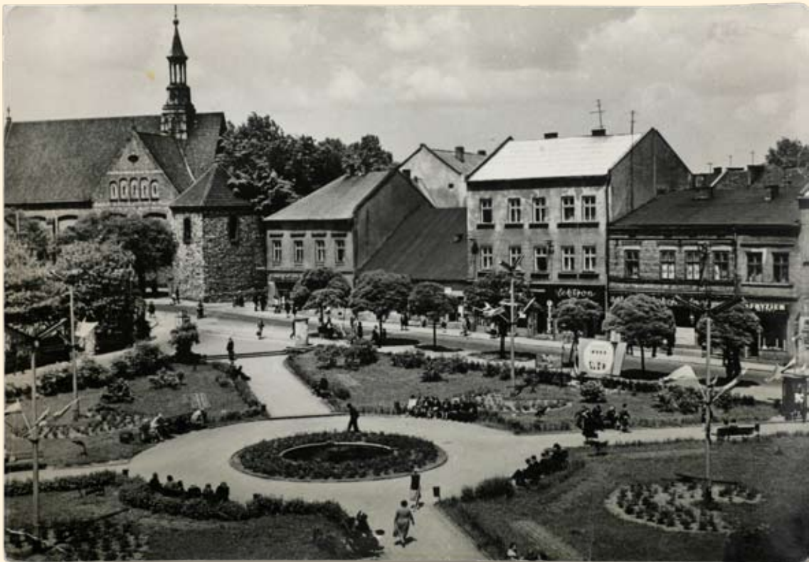
Ryc. 35 Plac Karola Marksa (Rynek). Wyd. PTTK, 1968 r.