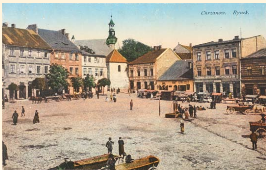
Ryc. 17 Rynek – pierzeja zachodnia i północna - widok na kościół św. Mikołaja. Nakł. T.K.Ch., 1914 r.