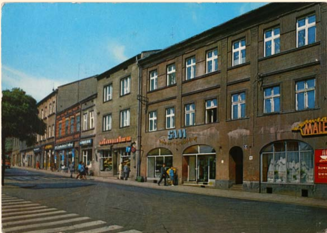
Ryc. 38 Kamienice przy północnej pierzei Rynku. Wyd. Biuro Wydawniczo – Propagandowe, fot. K. Jabłoński, 1973 r.

Tenement houses in Market Square up to Krakowska Street. Publisher: Biuro Wydawniczo - Propagandowe. Photo by K. Jabłoński, 1973.