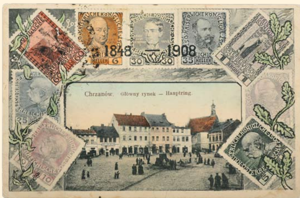
Ryc. 15 Rynek - pierzeja zachodnia i kościół św. Mikołaja. Wyd. J. Klein, Kraków, 1908 r.