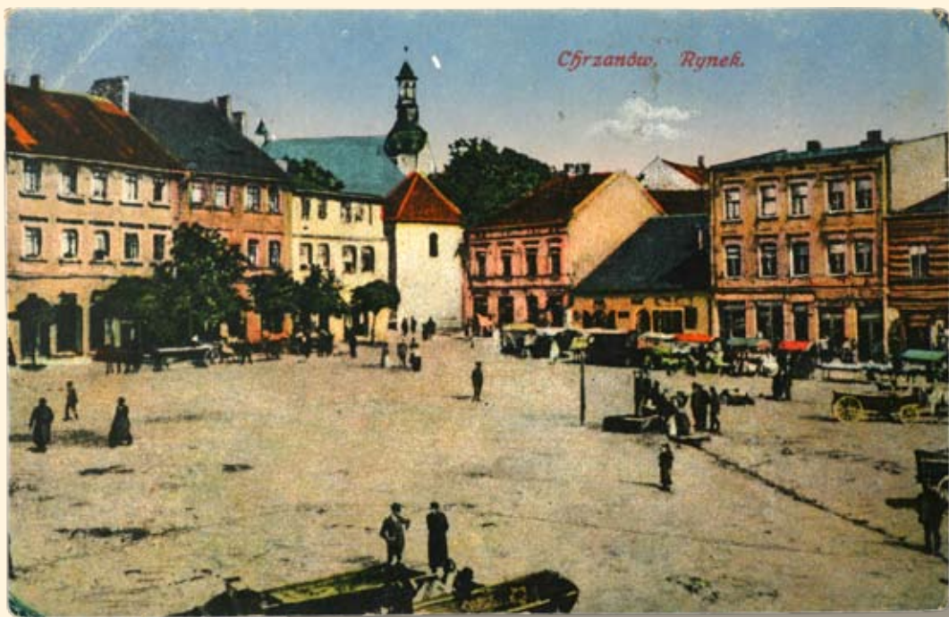
Ryc. 18 Rynek – pierzeja zachodnia i północna - widok na kościół św. Mikołaja. Nakł. T.K.Ch., 1914 r.