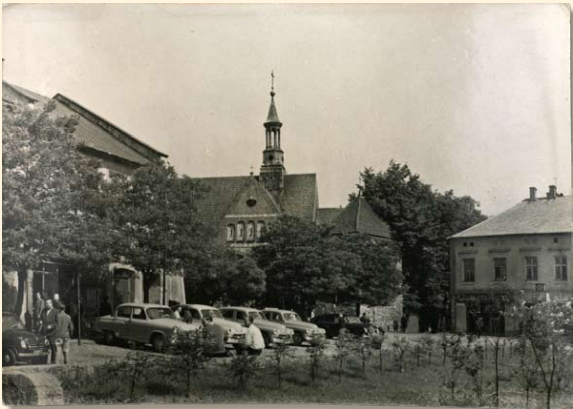
Ryc. 33 Rynek – kościół św. Mikołaja. Wyd. „RUCH”, 1966 r.