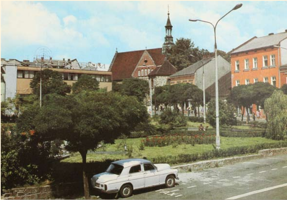
Ryc.42 Rynek – kościół św. Mikołaja. Wyd. Krajowa Agencja Wydawnicza, fot. J. Rosikoń, 1981 r.