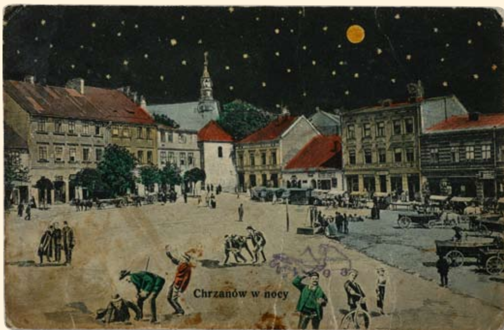
Ryc. 22 Kartka księżycowa, Rynek nocą. Nakł. T.K.Ch., 1914 r.

„By night” series: Market Square by night. Publisher: T.K.Ch., 1914.