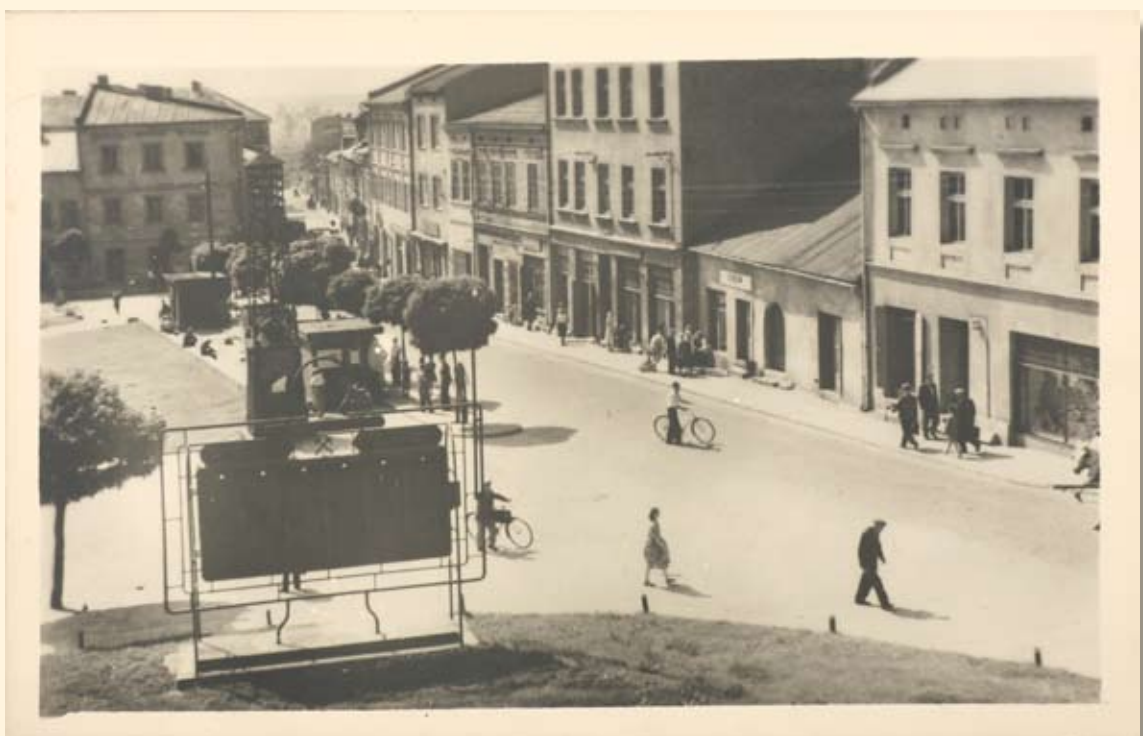
Ryc. 29 Rynek – pierzeja północna z perspektywą ul. Krakowskiej (błędny druk – odbicie lustrzane). Wyd. „RUCH”, fot. H. Hermanowicz, 1959 r.