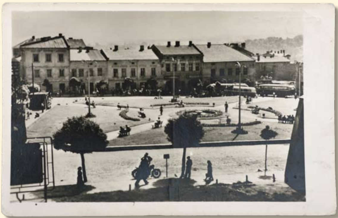
Ryc.30 Rynek – pierzeja wschodnia. Wyd. „RUCH”, fot. H. Hermanowicz, 1959 r.