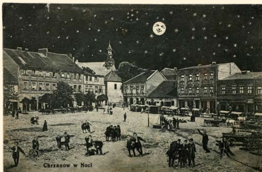
Ryc. 21 Kartka księżycowa, Rynek nocą. Uwagę zwraca napis na kartce „Chrzanów w Noci” Nakł. T.K.Ch., 1914 r.