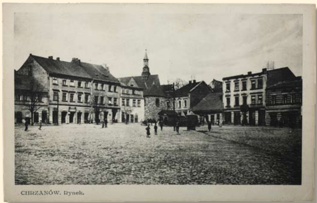
Ryc. 24 Rynek – pierzeja zachodnia i północna - widok na kościół św. Mikołaja. Wyd. Kazimierz Zarębski, Chrzanów, 1930 r.