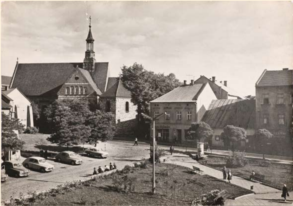
Ryc.32 Rynek – kościół św. Mikołaja. Wyd. „RUCH”, fot. K. Jabłoński, 1966 r.