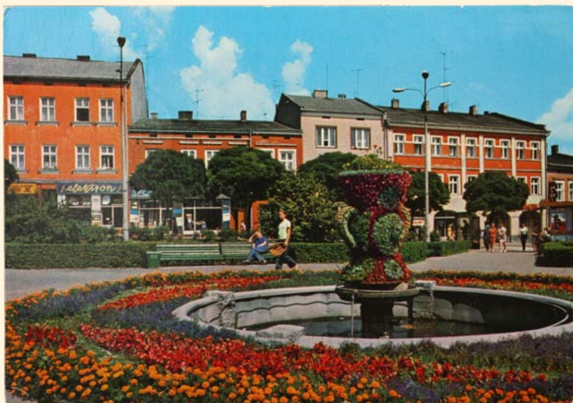
Ryc. 41 Rynek – pierzeja północna. Wyd. Krajowa Agencja Wydawnicza, fot. J. Rosikoń, 1981 r.