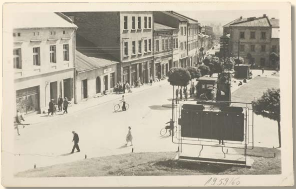
Ryc.28 Rynek – pierzeja północna z perspektywą ul. Krakowskiej. 1959 r.