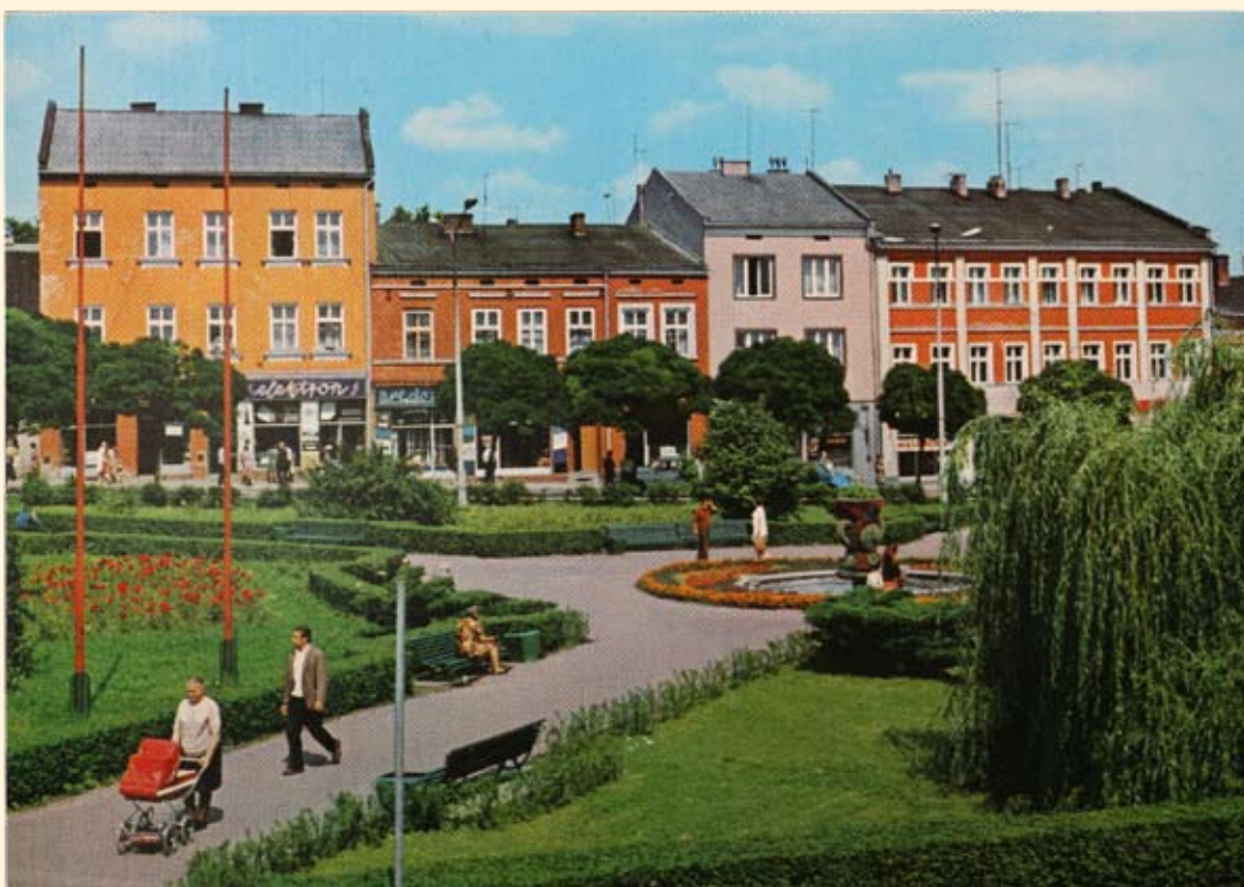
Ryc. 39 Rynek – pierzeja północna. Wyd. Krajowa Agencja Wydawnicza, fot. J. Rosikoń, 1981 r.

Tenement houses in Market Square up to Krakowska Street. Publisher: Biuro Wydawniczo - Propagandowe. Photo by K. Jabłoński, 1973.