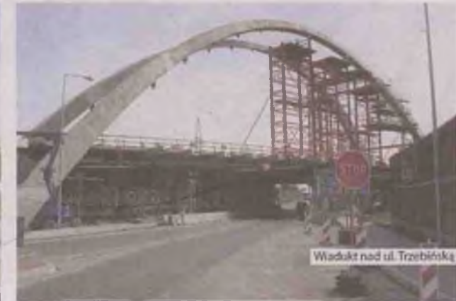
Wiadukt nad ul. Trzebińska