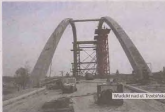
Wiadukt nad ul. Trzebińska

Aktualnie trwają roboty wykończeniowe na pozostałych odcinkach. Przewidywany termin zakończenia – 09.2013 r.