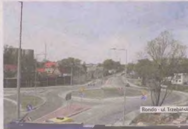
Rondo - ul. Trzebińska