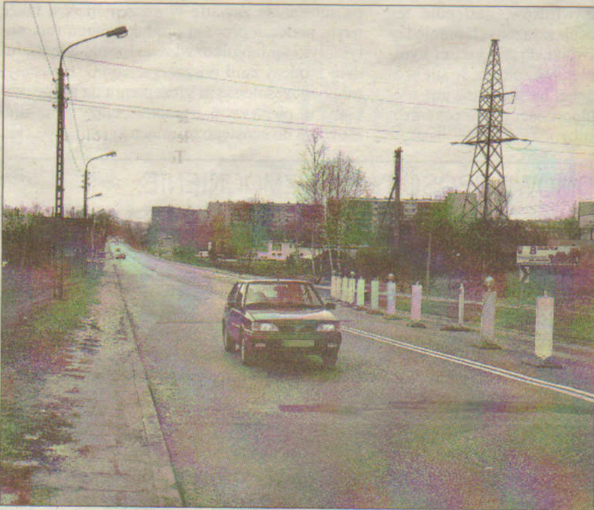
Ul. Trzebińska przed powstaniem estakady

CHRZANÓW. Północno-wschodnia obwodnica to największa inwestycja drogowa na ziemi chrzanowskiej od czasów autostrady A4, na odcinku Kraków-Katowice budowanej z przerwami w latach 70., 80. i 90.