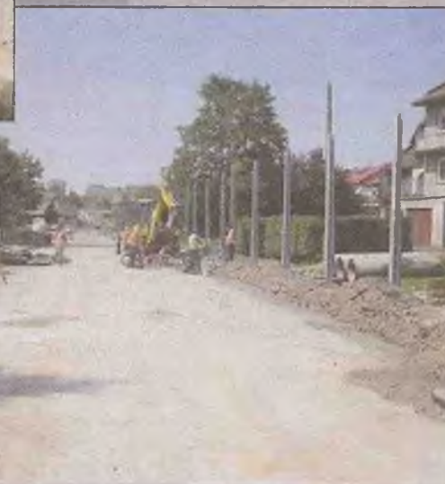
Rozbudowa odcinka DG 100670K – ulica Sikorskiego