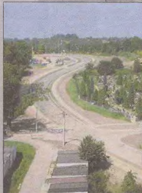
Budowa odcinka od ulicy Zielonej do ulicy Balińskiej