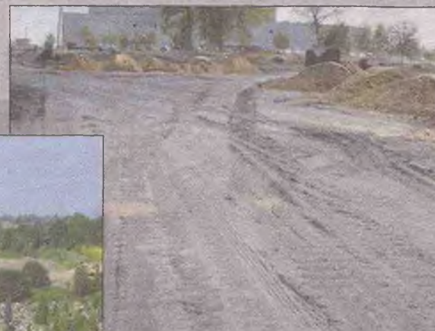
Budowa odcinka od ulicy Topolowej do wiaduktu nad ulicą Trzebińską (wraz z mostem nad Chechłem)

Po otrzymaniu decyzji o zezwoleniu na realizację inwestycji drogowej dla każdego z ww. odcinków rozpoczęte zostaną roboty budowlane.